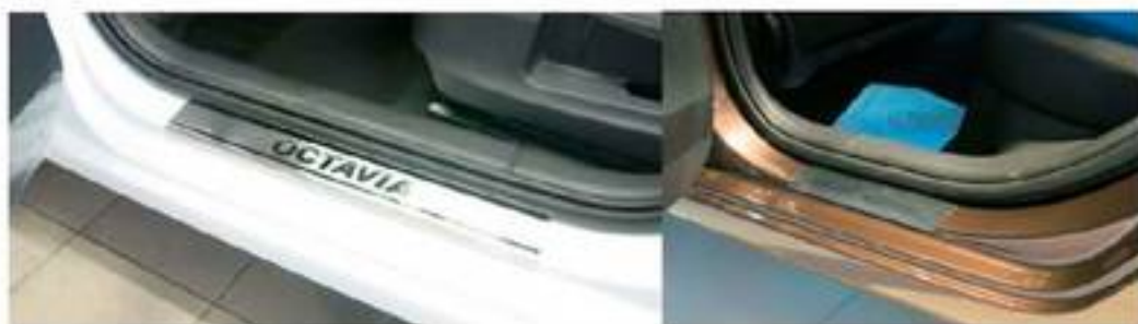
Фото установленных накладок

Накладки на остальные пороги устанавливаются аналогичным образом.